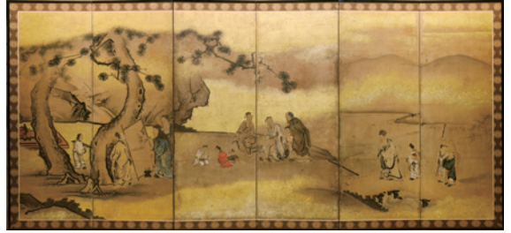
紙本着色琴棋書画図屏風 [宗教法人種徳寺蔵]

有形文化財(考古資料) 増上寺徳川将軍墓 礎石経 40,331点 [一部を展示]