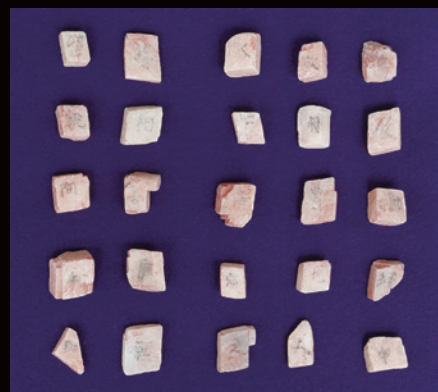
増上寺徳川將軍墓 礫石經 [宗教法人増上寺蔵]