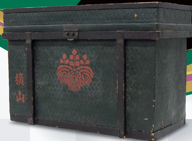
つづら 葛籠 [当館蔵]