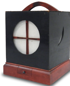
ありあけあんどん 有明行灯 [当館蔵]

本展では新指定文化財展と併せて、港区内外から寄贈された住まいに関わる道具を展示し、その使い方やエネルギーの変化に伴う道具の移り変わりを、大人にも子どもにもわかりやすく紹介します。また、小学校3年生の社会の単元「古い道具と昔の暮らし」も学べます。