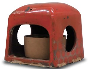
あんか 行火 [当館蔵]