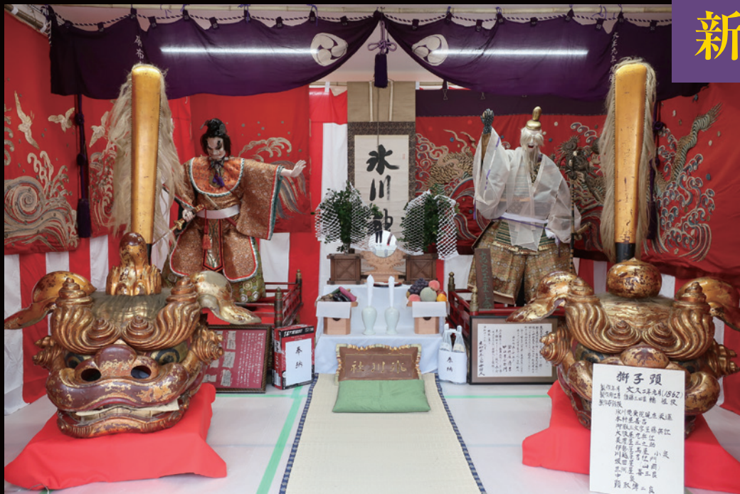
麻布本村町会 麻布氷川神社祭礼関連資料