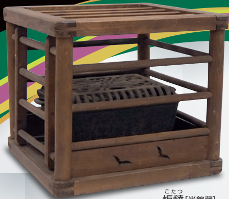
こたつ 炬燵 [当館蔵]