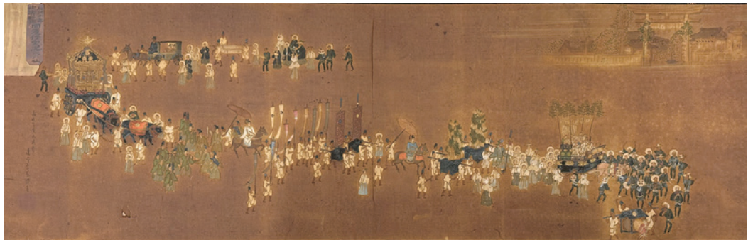
麻布氷川神社祭礼図 [麻布本村町会蔵]